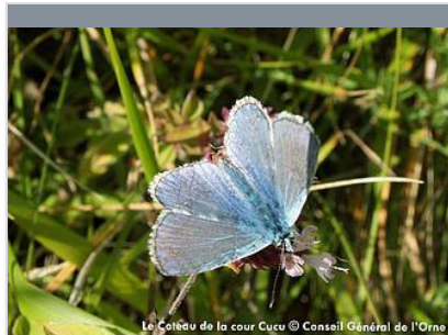
Le Coteau de la cour Cucu